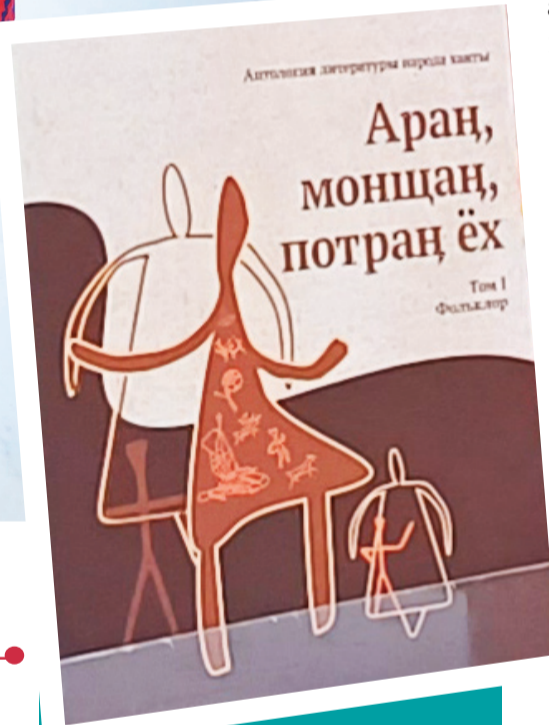
Зинаида Викторовна лув ёра кашң ай курта луңтапал тутдылды.

Ёмвош округан щикунш ар луңтап элдыйл, туп муң унтэв ар пелкал ант ёхтыдыйл. Куртан улты хоятлув щита этты нэпекат ёша паятты ант верытлалдал. Интернет щикунш ул, щит мохты рахал там йисан нэпекат луңатты. Туп, антом кашң хоят щи мутра тайл. Щи тумпийн хун нэпек ёшан каталдэн, лыпен аматан ёхатла. Луңтапен нэпек лопаслал тыел-тохел поныдыдан, туңа-щира вантыдыдан.