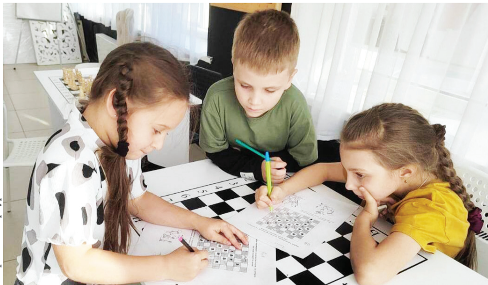
Хор: ИА «Приуралье»

Папус верты форум мет алаң пус кат тематической сменная манта питл. Алаң сменная профессиональной сообщества нэңхэт: гиды, туроператоры па экскурсия тутытат. Кимет смена па касад дытты нэңхэт ораңна питл, хой элты мув вантман яңхта омац па энамты нэңхэт туризм. 2024-мет тална Ямал мувна талд хуват ропытты энамты нэңхэт образовательной центр пунсса, лув энамты нэңхэт туризм па гостеприимство педа онтталды. Ши центр каман рот онтыды программат верл, топ лув энамты нэңхэт тотлиты, проводник-гидат па экскурсоводат.