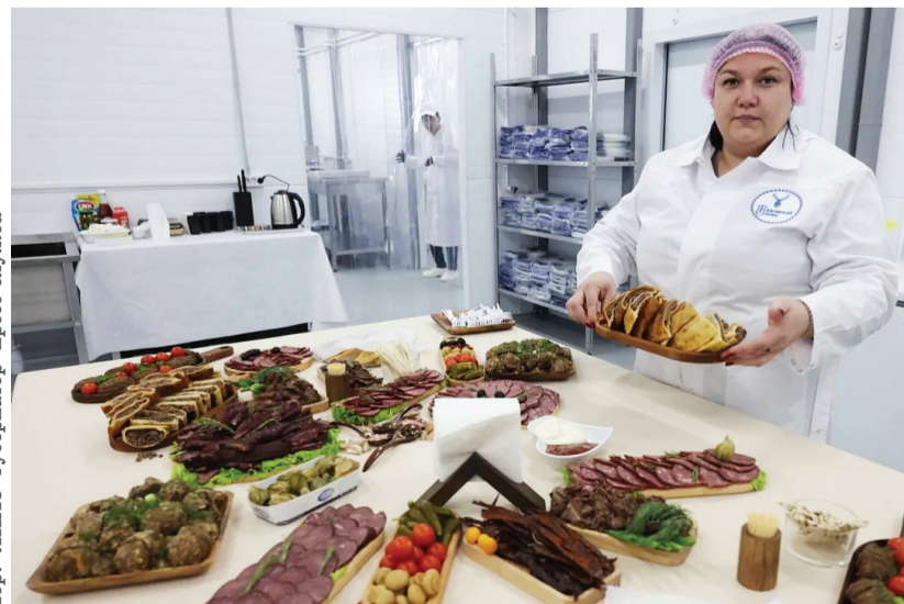
Хор: ЯНАО губернатор пресс-служба

Ин округев хуват нядхосьяң симась хот рупитал. «Тазовские олени» хот тумпийн, Пулцават вошан «Ямальские олени» па Харп вошан МУП «Паюта» вуды нёхи дэсятты хотатан вуды нёхи тумпийн тащ лэты сирн нёхи верты пилта. Сишан шоши мир хоятлув аршак вуды маты верытлат па аршак ох ёхтапаты.