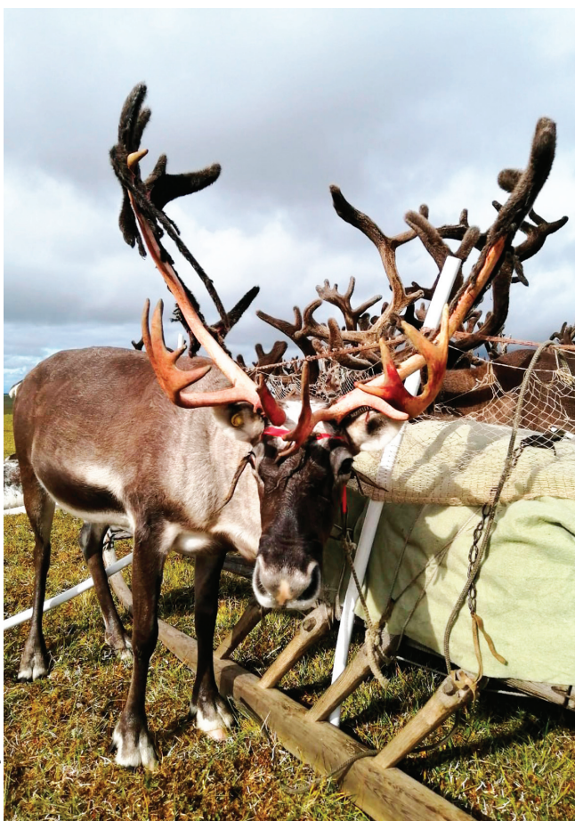
Сидяҗг. М. Окоэтто' таavy