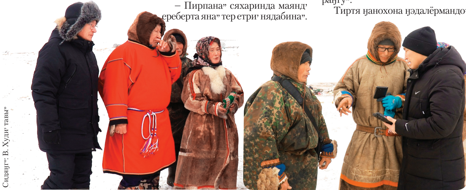
Сидяңг.: В. Худи, тавы"