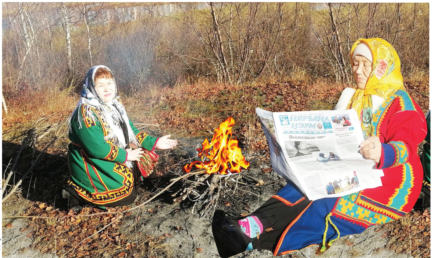
Сидяҗг. Г. Окоэтто' җэдабтавы