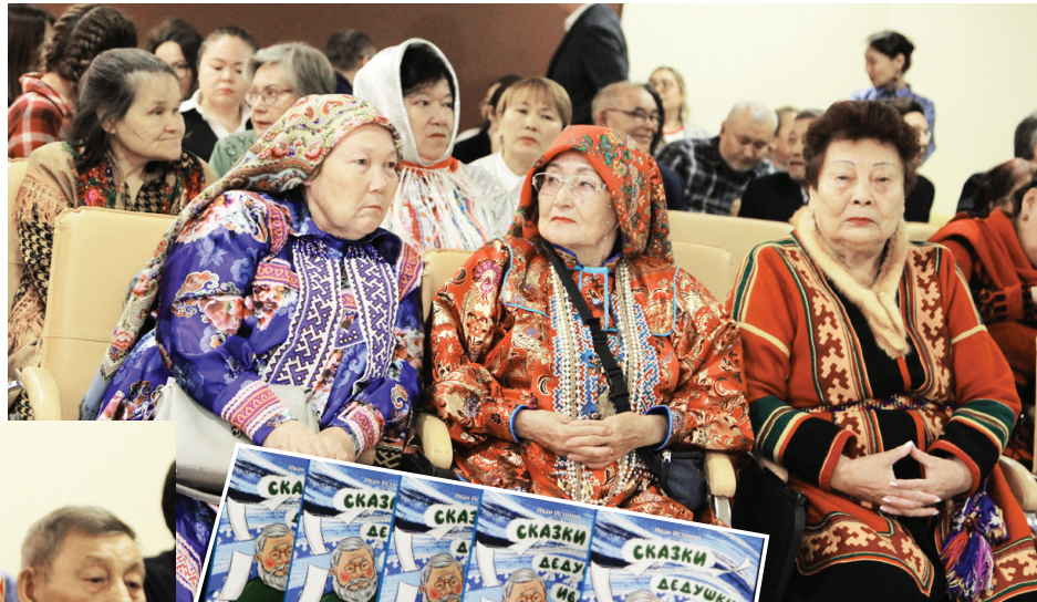
Сидяңг: М.Яр тэдгавы

Хор” иры’ юкад вата сам- лянзимдей яляхана тодо” тэнз” ненэцие” ед’ тасла- вы толаңгулава хардахана округна” тер” паднана” ненэця” ма”люрҕаць. Поңганандо’ ҕа”и” похот паднана”, тандая’ падна пэвы” мэць.