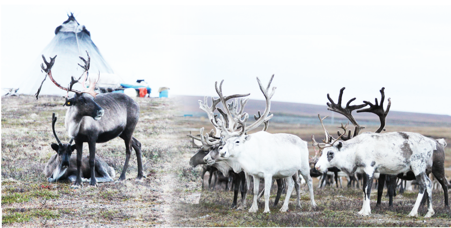
Сидяңг: М.Яр’ тадтавы”