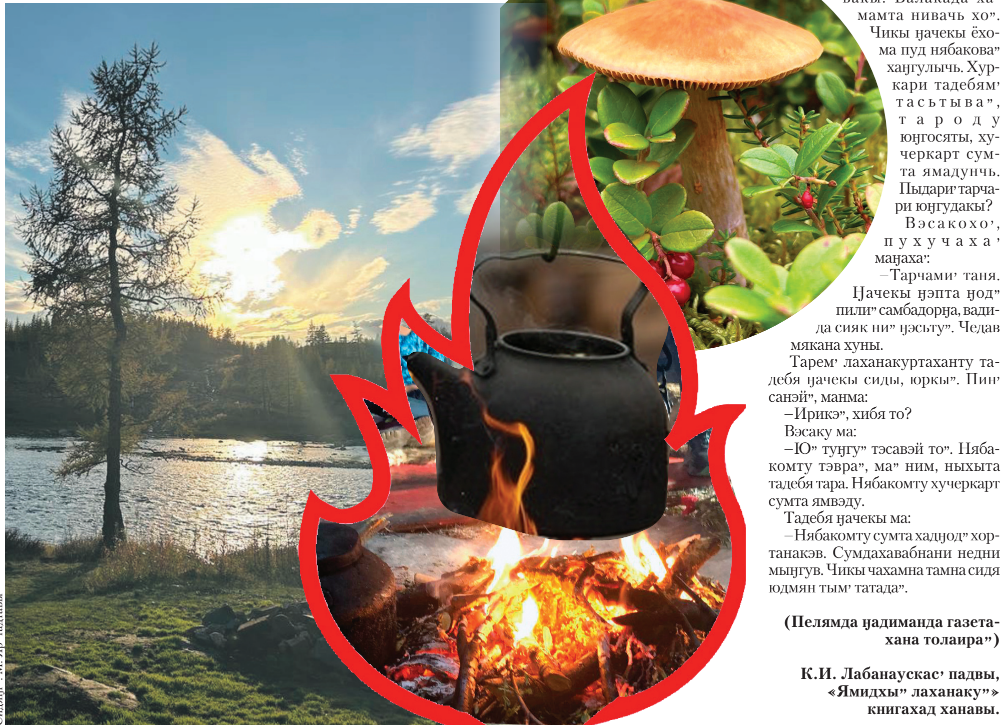
Сидяҗг: М. Яр' талтавы"

К.И. Лабанаускас' падвы, «Ямидхы» лаханаку»» книгахад ханавы.