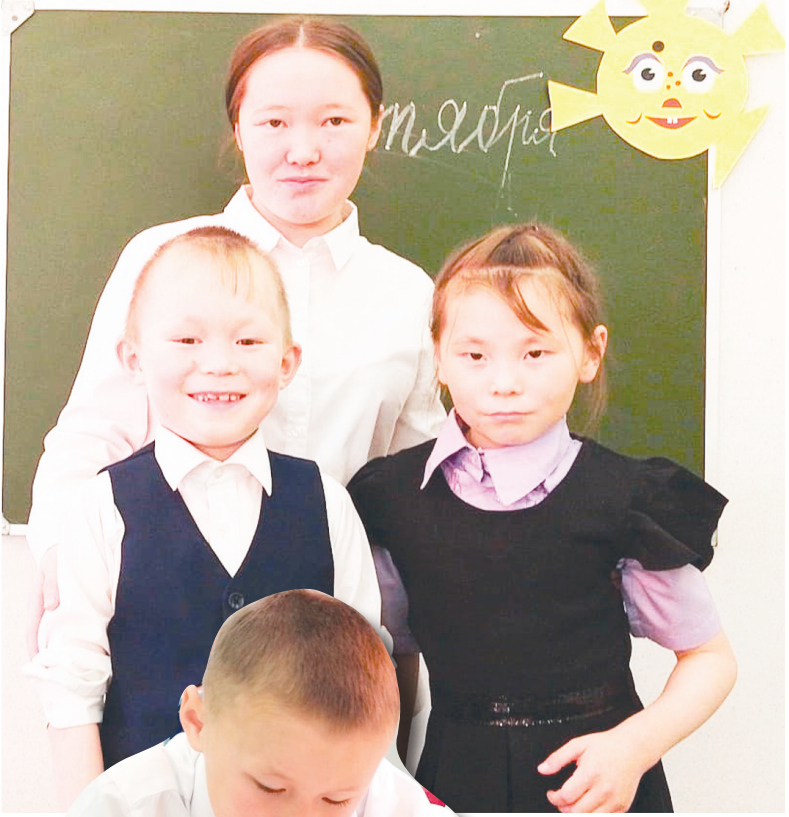
Сидиңг: К. Яндой' тавы"