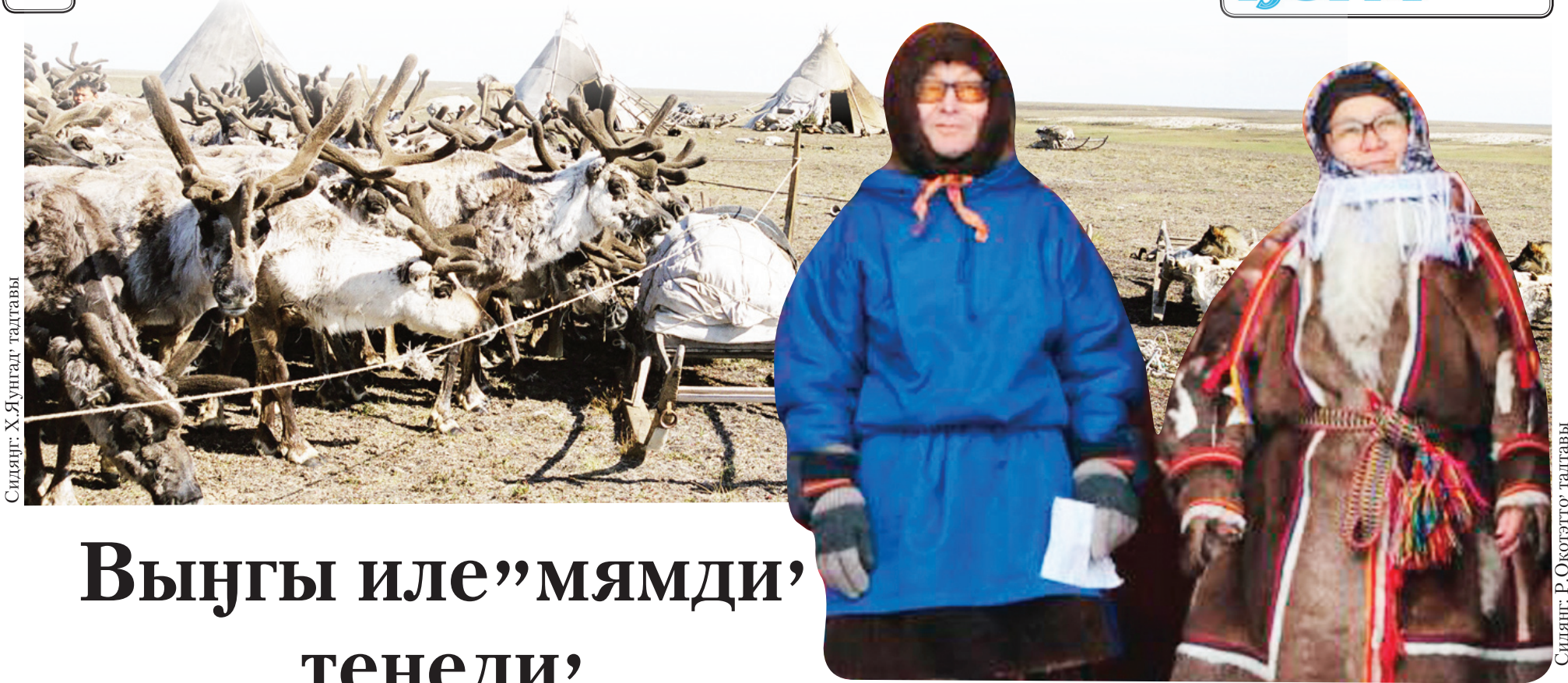
Сидяңг. Х.Яунгад тадтавы