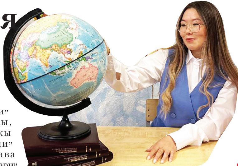
Сидяңг: Х. Вануйты тавы

тамини манзараңгуда"ма. Тарем' тасламбив, җацекеы тохоламбада манзаямда җули" савовна теневабата тара. Ңацекеыда сававна хамедамбаңгува. Хусувэй ялями нянда то"олха ни җа". Тикы манзая җули" иликабты. Тохоламбадини хуркари едэй җамгэхэ" тохоламбин". Пыдо' индо' ядан' тохолку". Саць саңговота сер" ни җа". Манзаянда савовна мима' еэмня ненэць' етри' харта тохолкобта тара.