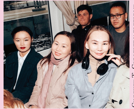
Сидиңг: Т. Сарогатто-тадгавы"

Российская Федерация Ямало-Ненецкий автономный округ