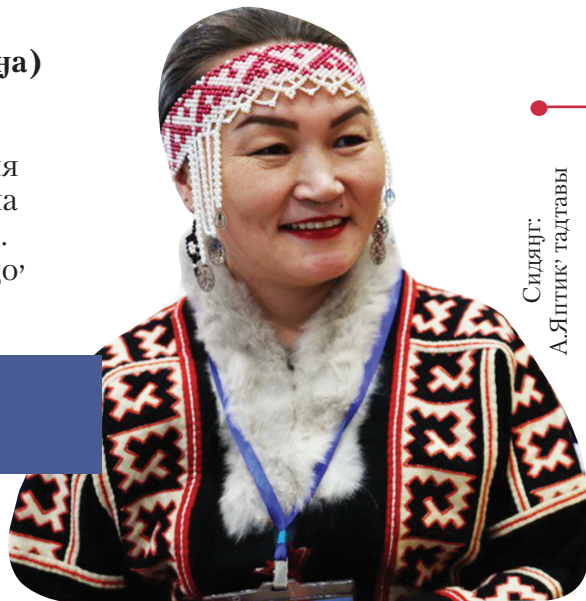
Сидяңг: А.Ялтик тадтавы

Хар"на" вадавнана" җэда сё", лаханакон" нямна җацекеы" етри' няданда хонаркосеты". Ңарка нядо' сидто' табедангу,