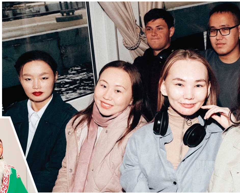
Сидяңг": Т. Сэрогэтто' тадтавы"

Тарця вади" пуд мале сянңэ ансамбльдамдо' һадимде". Нюрте" таравамдо' литературам' манэ"лабтамбава' яляхана мэ"һадонзь, тикамдо' «Сеңгакоця» сё' ед' сертадонзь. Тики яля' сидто' манэ"манзь мале сян ненэця" товыць. Тики' хавна Ямална" литература' сайтм' манэ"лабтаць. Сайтханандо' округна" тер" паднани" манзаи хось пиртада": луца", ненэй' ненэцие", хаби", тасу