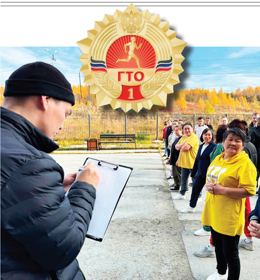
Таттама Андрей Пяк таттамы

Чикиџ камна тоходампючетуџ џашкайтуџ шичитуџ маньдеш џупчики таньше мэшту". Самбудкахана школахана мансданни" камна џыди организацихина" мэна" џупчики ГТОхана пытатуџ конулпиш". Ёука неша" спортивный' нормативутоџ хомана шедтадятаџонъш. Кимья тамна ГТОмта ниша мис, чуки пуџ хусыт дџџышат шедташ тада. Талъша нормативу" нямапџџа" нельшту куняна чикитуџ нямапџџаштамтоџ паташтуџ. Кимья кудка норматив' шедташатым, шан потуџ џаймя нямна таслаштуџ. Кукят ха"мольшту, вџнтольшту", кукят шудвидьшту", дяттольшту", џай џыди упражнении" шедташту".