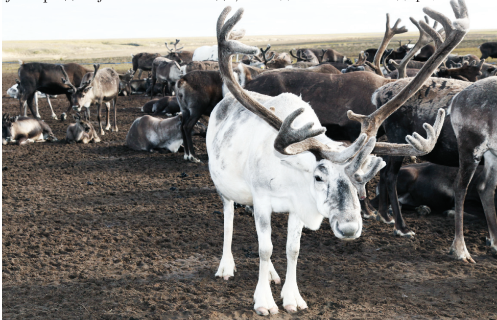
Сидяңг. Х.Яунгад тадтавы