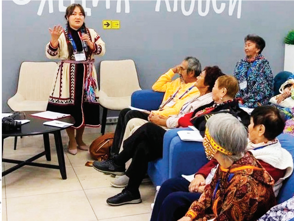
Сидяңг": С. Тусида' тавы"

Теда' һобтики тарана серо ваде"мы". Невхы иландо' недам' ното' ила' сехэрэңэ харвабтадо'. Һадьбаты' пили" нюрте"э' вадамдо' лэтраван харва". Тики' е"эмня тодо тэнз" нэрм' няна илена няхатато' табекодамдо' шорһа".