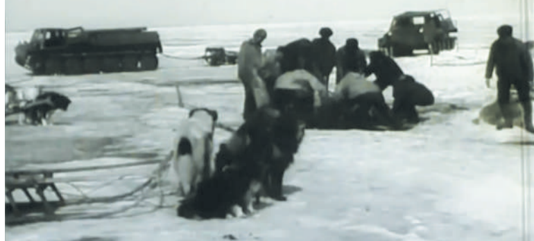
Скрин-кадр из видео «Ямал-Медиа»

Новопортовский рыбак бережно хранит многочисленные грамоты, которые свидетельствуют о его профессиональных заслугах.