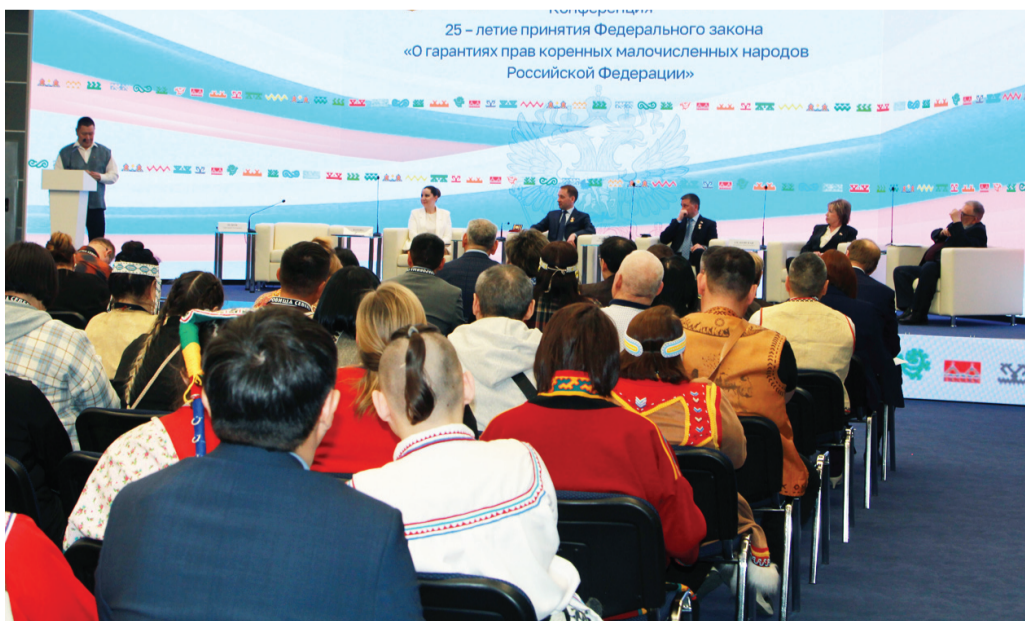
Сидяґг: М.Яр' гадгавы

Маня' ненэй ненэця' нява' џани' таявы. Вячеслав Аськович Салиндер - Тазагрорыбпромхана ёртя. Пыда иланда ямбан' халям' пэртяґэ тара. Поґганда тер' сяхаринда нерняна мэсеты'. Нянда сыраць илебей' ненэця' џобтики хэвхананда варемдо' мэ'ґа'. Вячеслав Аськович' поґгада тамна пон халяхат пан'ґая. Пока хибям' яля' няю' тидхалея.