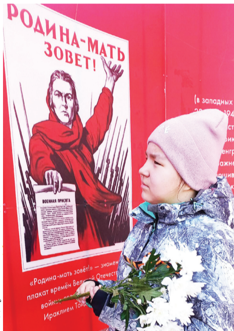
Сидяҗг. Г.Кинчина' тадтавы

Ямал' җардавна хусувэй нюдя хардахана, җарка маркана ненэця'' иле хардато' ненадо яхана ма'лёсеты''. Тovy ненэцяндо' етри җока җэсеты. Җарка нито' поҗгана җацекеця'' ядэрцеты''.