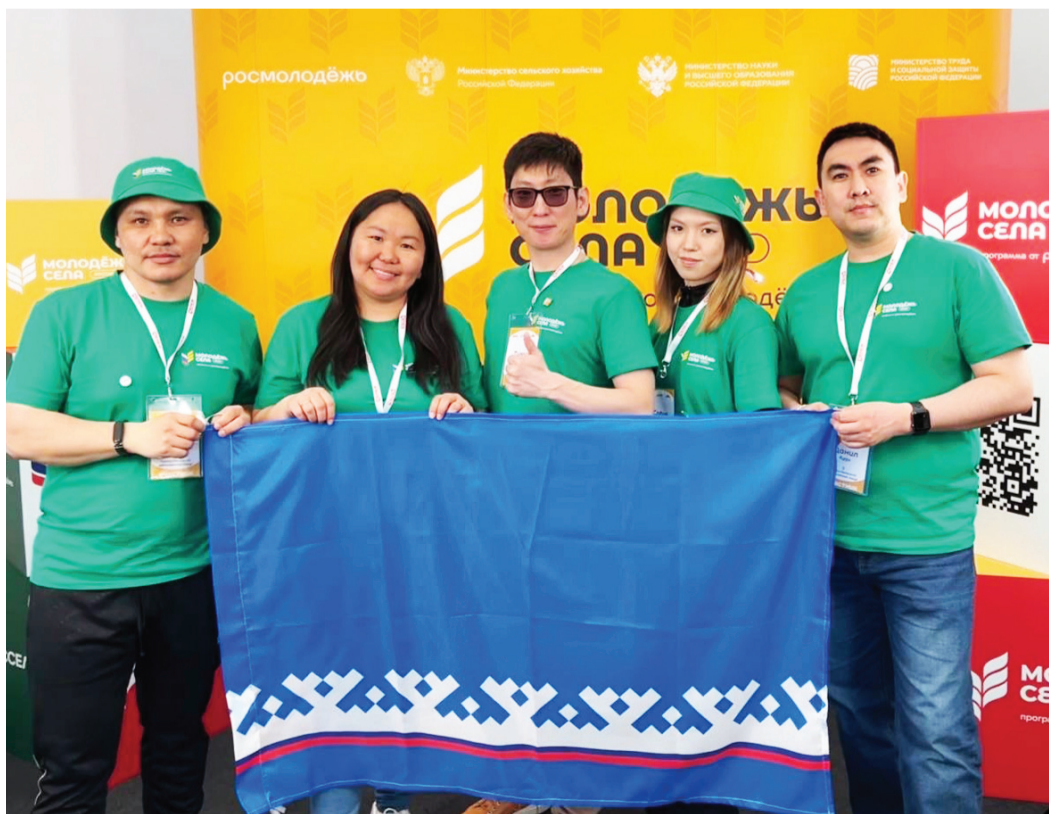
Сидяңг: yamal_rssm няд ханавы

Тохолковандо' пуд «Лиде- ры села» пирдырмам' нэвы". Ханяңы" мале пыхыдадо' тикан' падвыдо'. Сую" ниць иры' 31 яля' һэсонд' падродо' лидерысела.рф сайтан' һэдара пиртыдо'.