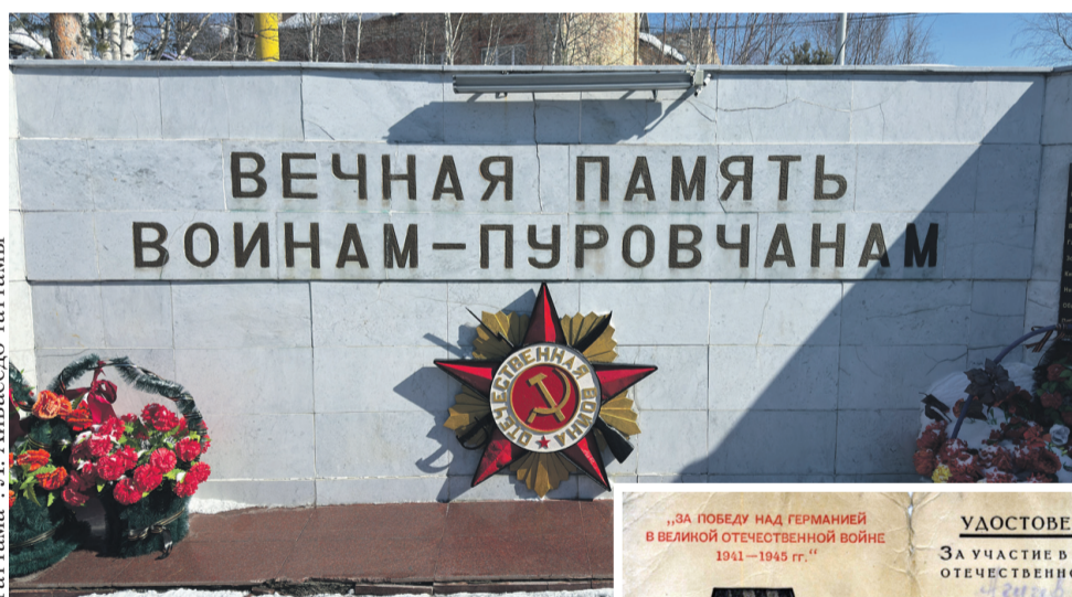
Таттама": Л. Айваседо таттамы"

Пуровский районхана ты" паделдыш мансланна", калитана"