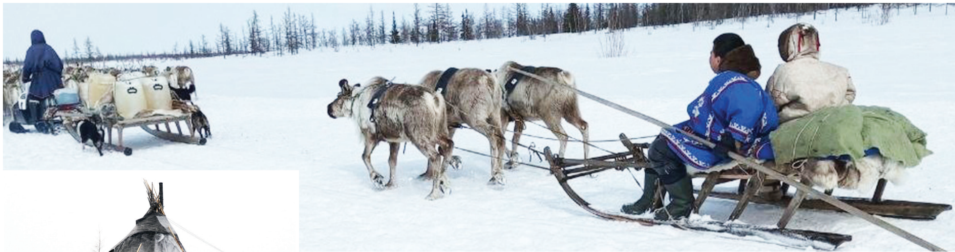
Сидяңг: А.Ялтик' тадгавы