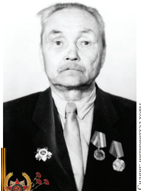
Сидяҗг. интернетхад ховы