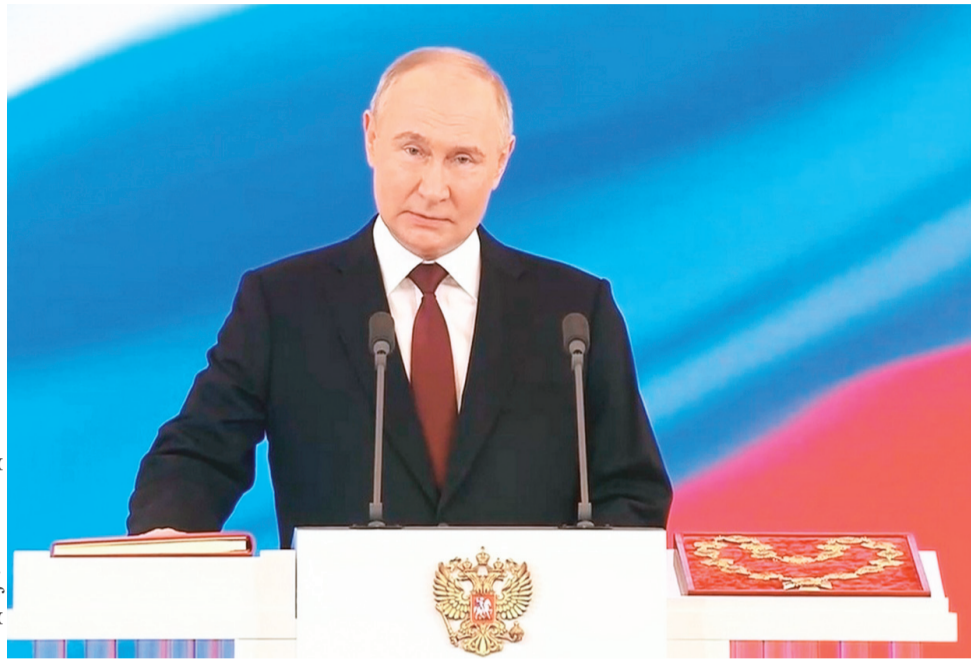
Сидяґг: ТАСС иад ханавы

Российской Федерация' Президентґэ таралмада луца вадавна «инаугурация» нубе'ґа. Тикы' ненадо сер' етри' Москва маркана џэсеты. Нюртейґэ џарка лохо' мю' Президентской