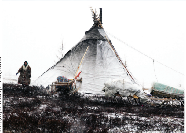
Сидяңг: М.Яр' тадгавы