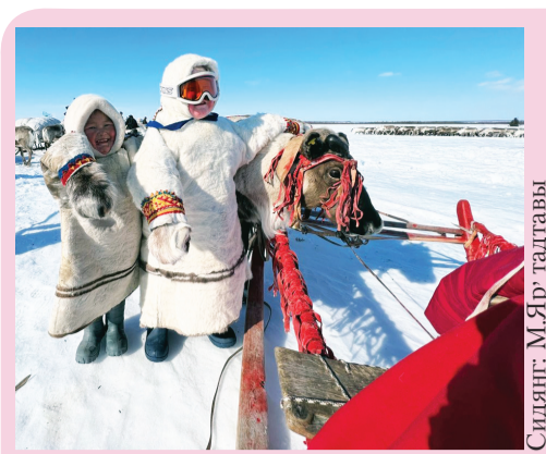
Сидяңг: М.Яр' тадтавы

Российская Федерация Ямало-Ненецкий автономный округ