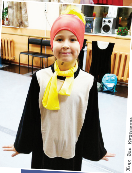
Юлия Малышкина няд тад якад.

Хорамаңа ләцатам вантопсайн антет-ащет, рут хоятат умащдыман вантсат, хоты ал волиты ермак щашкан элты ёнтам сохатан няврэмие