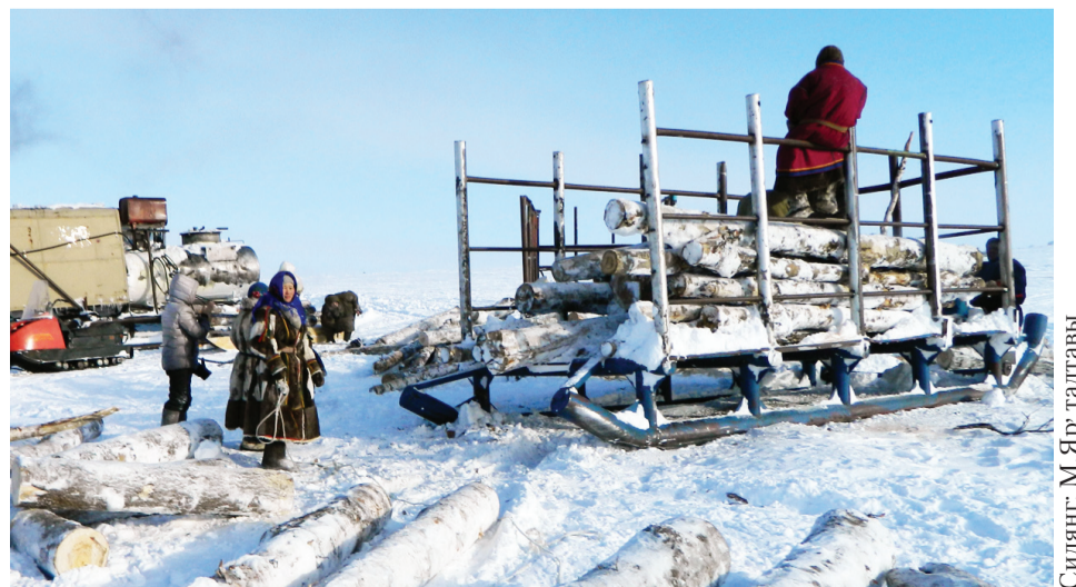
Сидяңг. М.Яр" талтавы"

Тасу" яв" няна ноккоюм" пито" пелям" та" имня тэврамбасетыдо". Теда" малё Сэхэрэяв" няю" нани" пэхэрэй тэвравыдонзь.