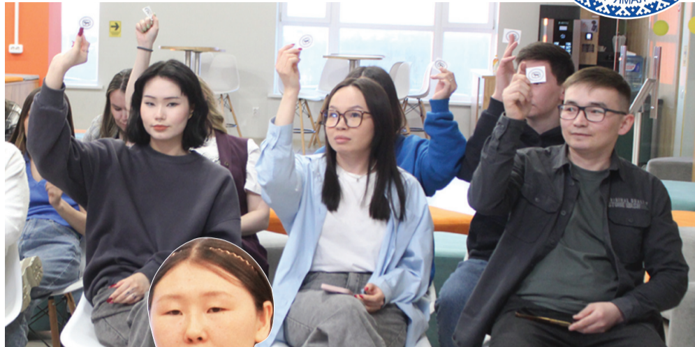
Сидяңг: А. Яптик' тэдгавы"

Нянда пуд Яляне Лаптандер лахана пэяць: - Колледжхана нябимдей по' тохолкурнадм'.