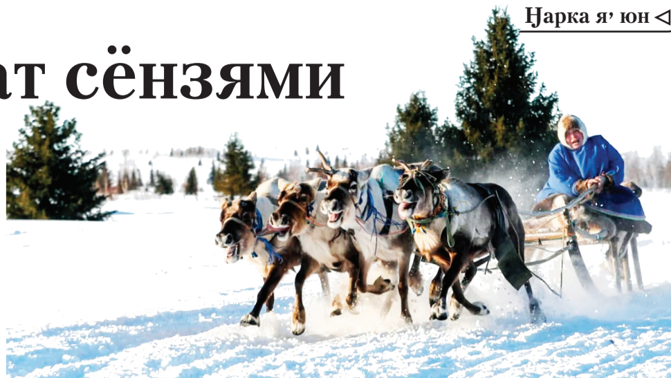
Җарка я’ юн

Тикы’ нерцюна «Рассвет Севера» колхозхана серодо’ тоенаць, ты пэртя” маяндорць илець. 2018 похона колхозхана манзарана”