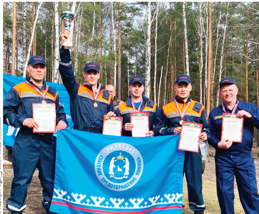
Сидяңг: dggz_уапао нид ханавы"

Си"ив яля' пирт' ехэрана яхана тохолкурмы". Ңэвто' мю' пэмы" теневабцудо' пуна манзаяханандо' ңули" тараңгу".