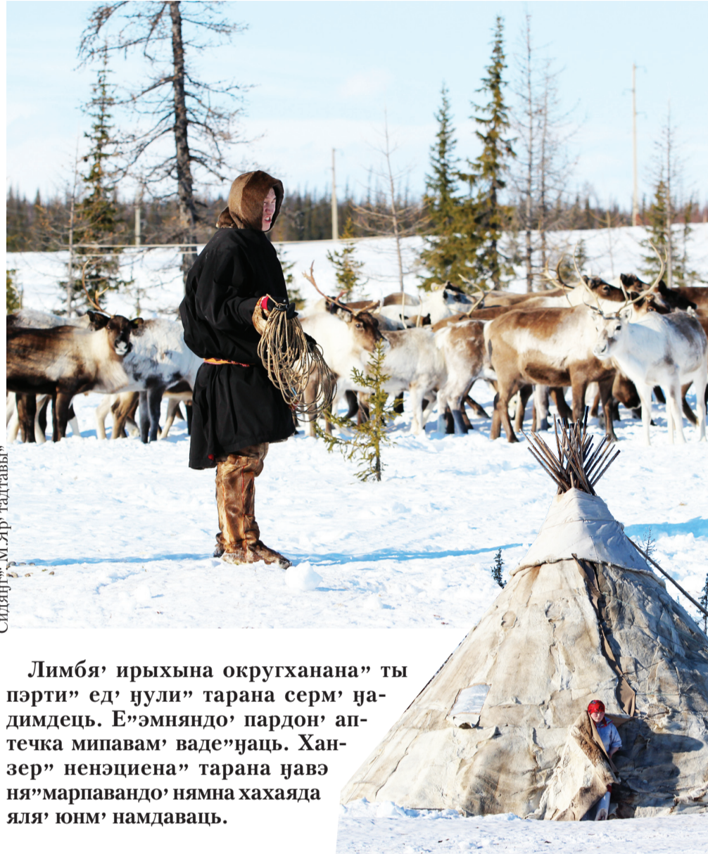
Сидяңг. М.Яр" талтавы"

Лимбя" ирыхына округханана" ты пэрти" ед" нули" тарана серм" надимдець. Е"эмняндо" пардон" аптечка мипавам" ваде"наць. Ханзер" ненэциена" тарана нэвэ ня"марпавандо" нямна хахаяда яля" юнм" намдаваць.