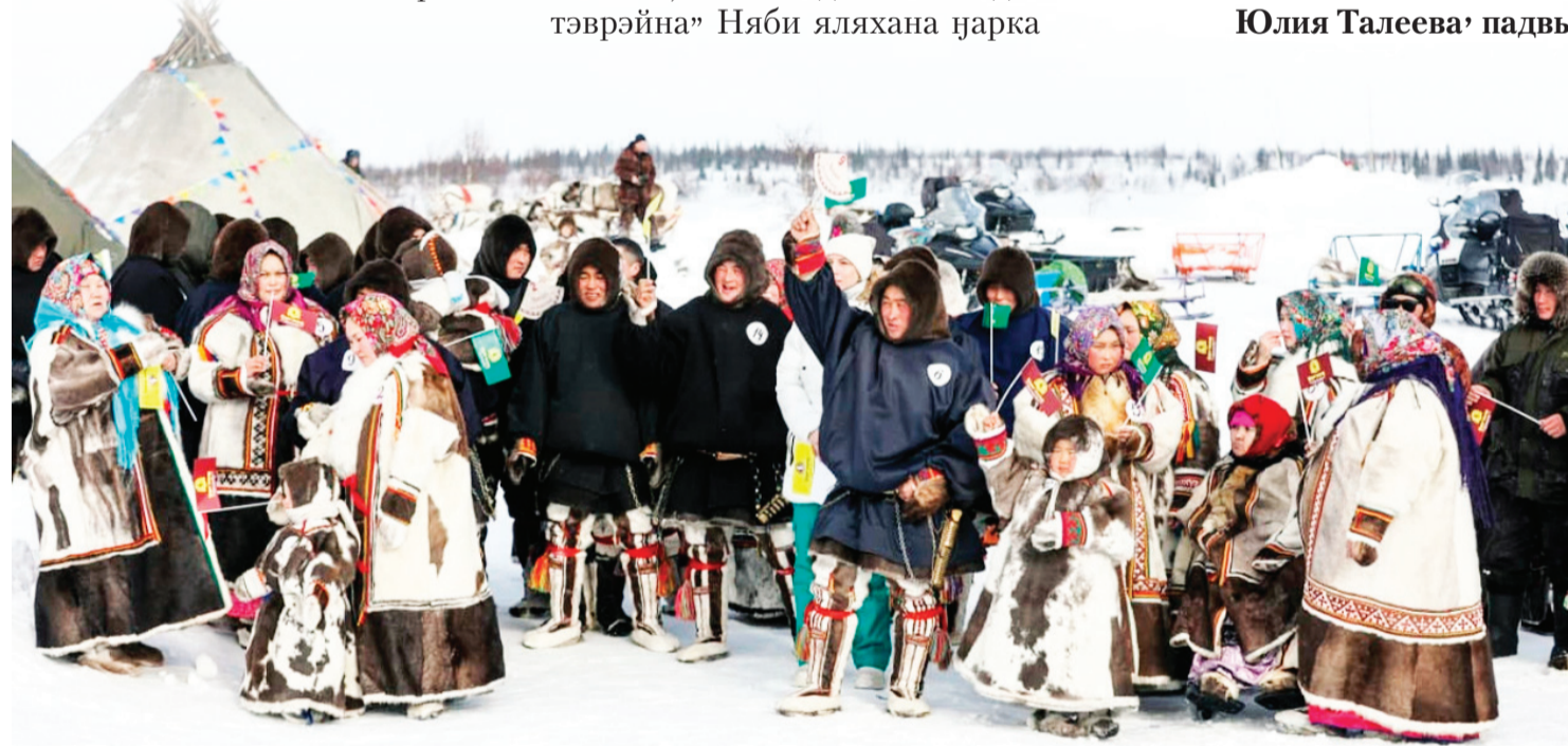
Смляңг. Ю. Талеева’ гадтавы

Харута’ тер” «Нэर्म ялумд» нюбета ялям’ җатедонзь. Теда’ хойхана мюсерта” нод” тев’ ёльцяңгана сян’ ныланава ялякодо’ тания. Пыдо’ җарка ялямдо’ мэ”манзь җани’ турҗаць.