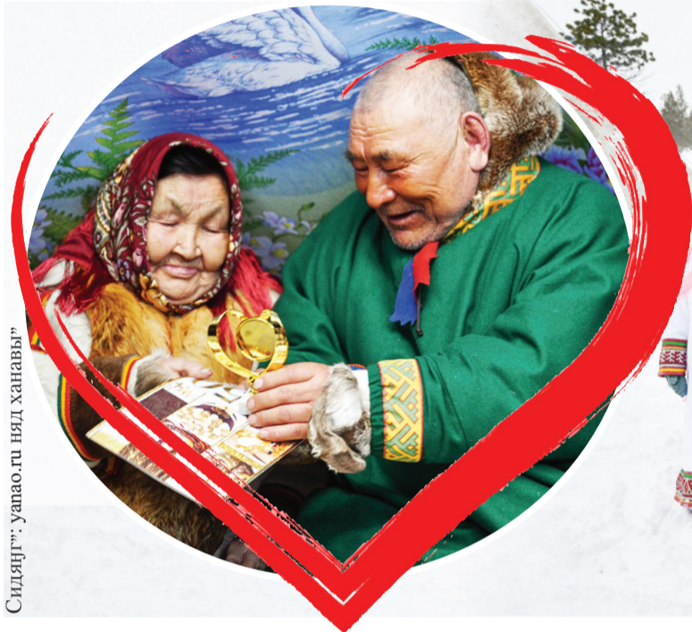
Сидяңг: уапао.ги няд ханаваы'