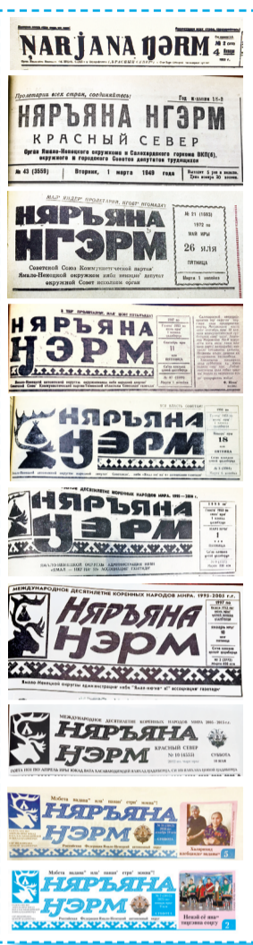
Сидяңг. Л. Вануйто' тавы

Ѓани' џобаңгуна редакцияхана ёльце пирцяка"я илебей ненэця" тю. Сидя юкад вата пода џэраха. Ма"нив, газетахана ням-