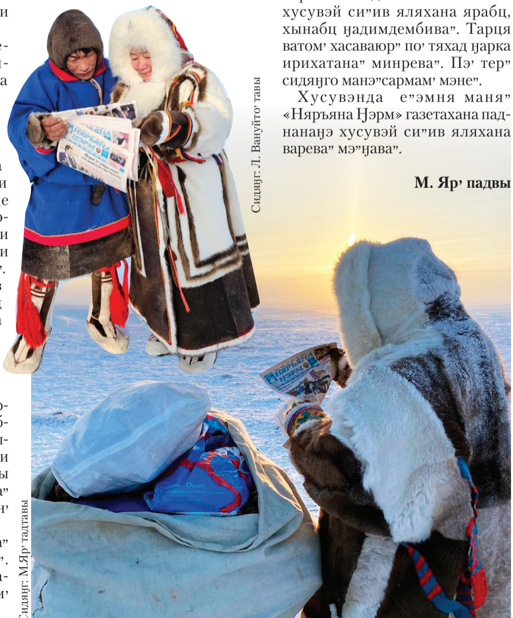
Сидяңг. М.Яр' талтавы