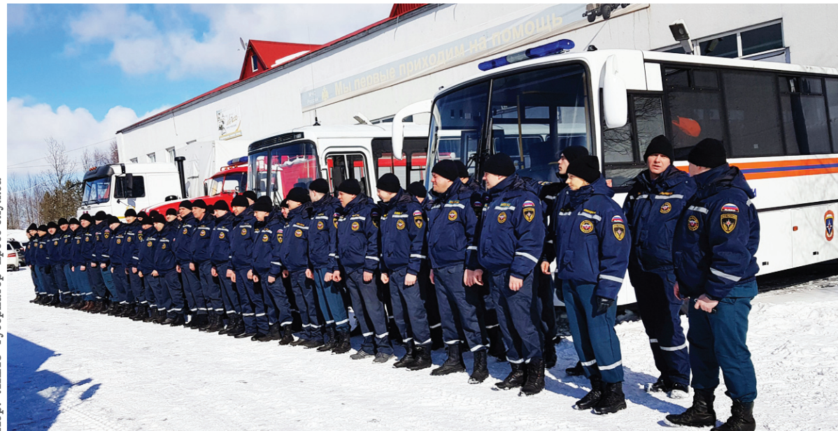
Хор: ЯНАО губернатор пресс-служба