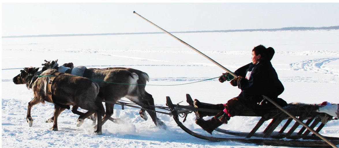
Хор: «Дух Авт» архив